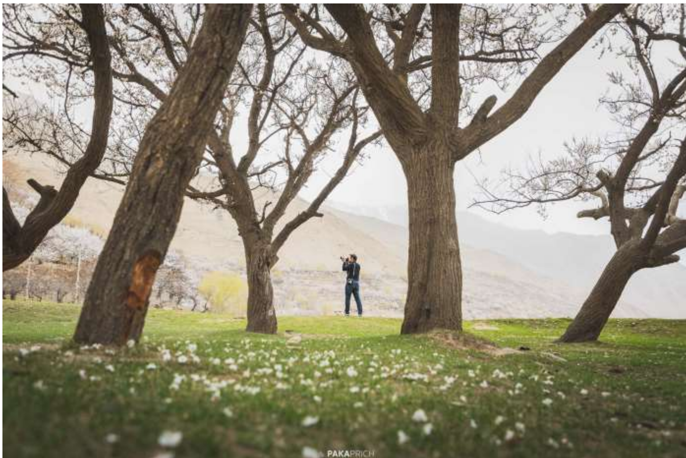
ต้น Appricot ในฤดู Blossom