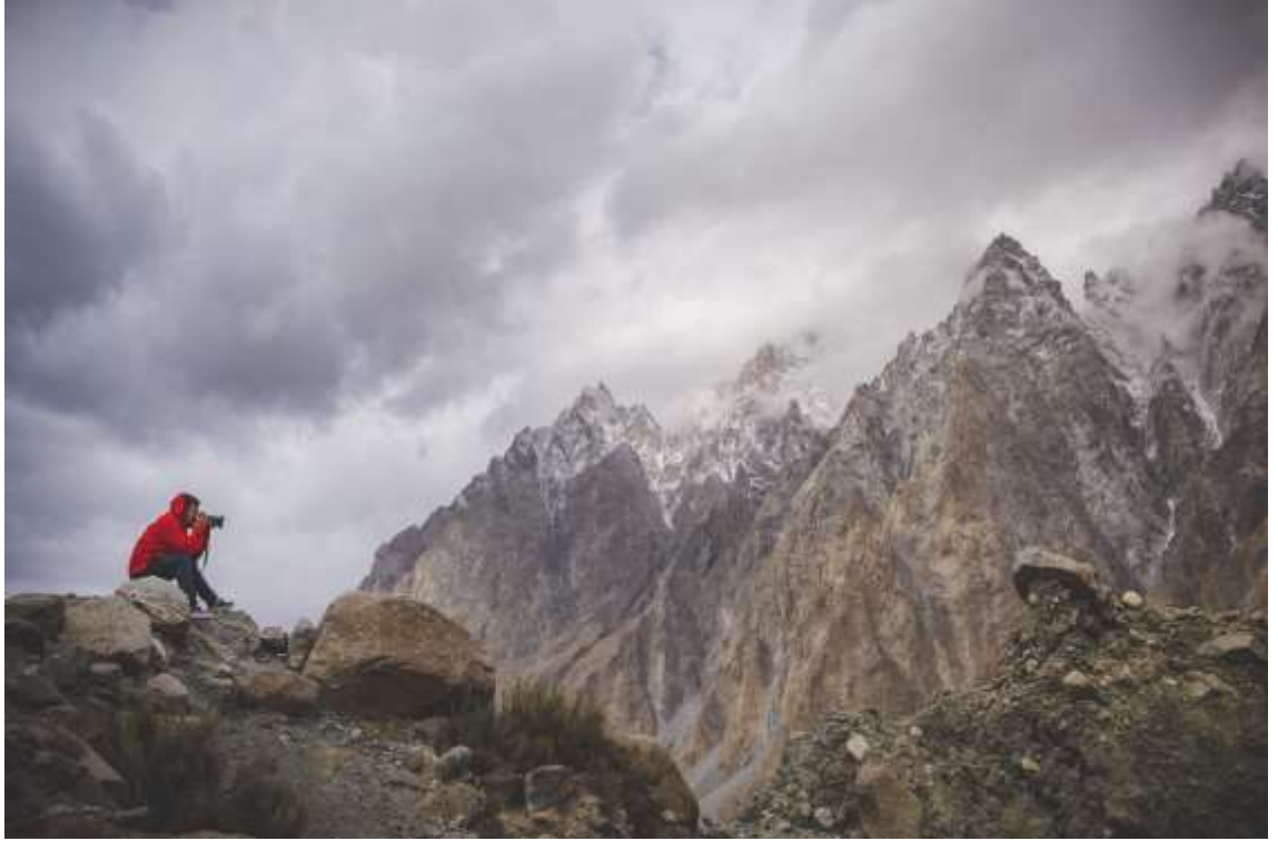
หมู่บ้าน Passu Village