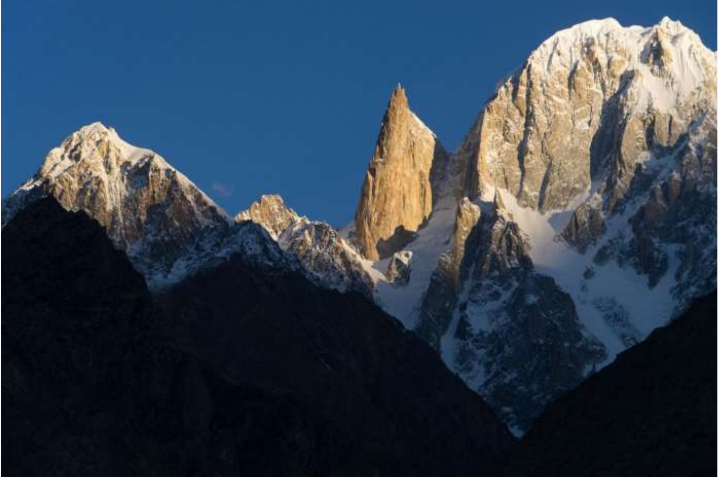
Lady Finger (6000m), Hunza Peak (6227mชาวสุด)

เช้า ปลุกตื่นเก็บแสงเช้าบริเวณจุดชมวิว Eagle Nest เพื่อชมพระอาทิตย์ขึ้นจะเห็น วิวพานอรามาของ เทือกเขาสีขาว สูงมากกว่า 7,000 เมตร Rakaposhi,Diran,Golden Peak,Ultar I Ultar II และ Lady finger