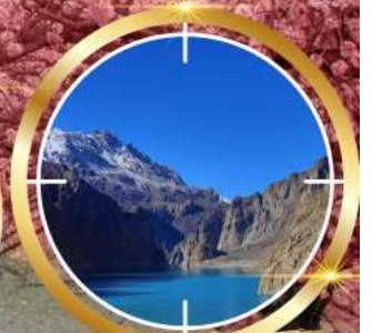
GUPIS ATTABAD LAKE